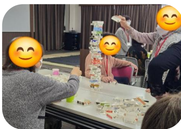
タワーゲーム(3月3日)

待ちに待った桜の季節となりました。今年の小矢部川千本桜はどうでしょうか。たまには桜を見に小矢部川の堤防を散歩するのもいいのでは？ほがらかデイも満開の桜のように元気ががんばって活動しましょう！4月の活動内容は右記のとおりです。