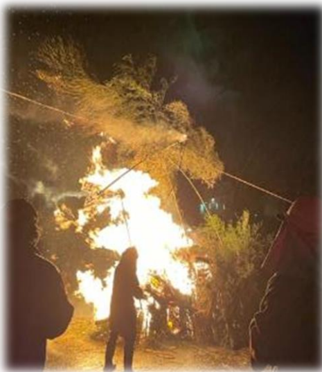
荒木町での左義長風景