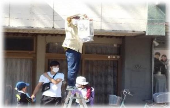
行燈を取付ける学年委員(保護者)