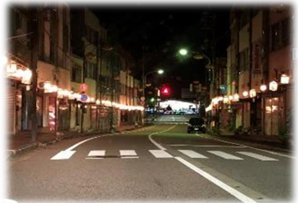
福光橋から見た行燈