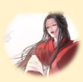
『下照比賣命 (シタテルヒメミコト)』