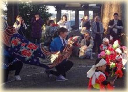
喜志麻保育園園児による獅子舞