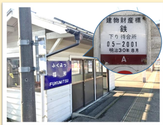
現在の福光駅下り線 城端線の待合室

前回、お伝えした福光駅構内にある明治時代の建物。正解は。。。下り線ホーム、城端線のりば待合室でした！証拠の写真がコチラ。大人の目の高さには識別標があります。明治30年8月とは、福光駅が開業した月。蒸気機関車走行時から、現在に至るまで、多くの乗客を見守っている建物です。