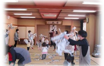
新聞を使ってリズム遊びをする親子

尚、第4回 ちびっこハッピータイム 「0才からの運動遊び」は、下記日程にて開催 予定です！