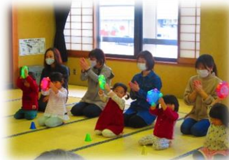
楽しくリズム遊びをする親子

参加された親子は感染拡大防止の為、適度な間隔をとりながらも楽しくリズムに合わせて体を動かしたり、母親同士で日頃の子育てに対する思いを話し合ったりして楽しい時間を過ごしていました。